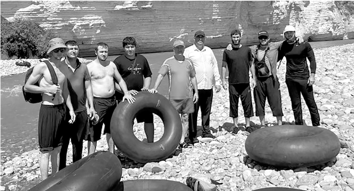
Участники сплава по реке на автомобильных камерах

— Это еще в детские мечты уходит, когда мне и моим приятелям лет по десять было. В реч-