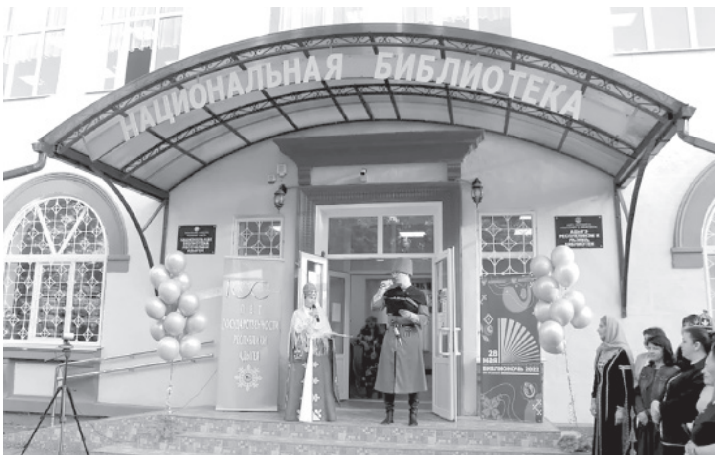
Сегодня Национальная библиотека Адыгеи — настоящий очаг культуры