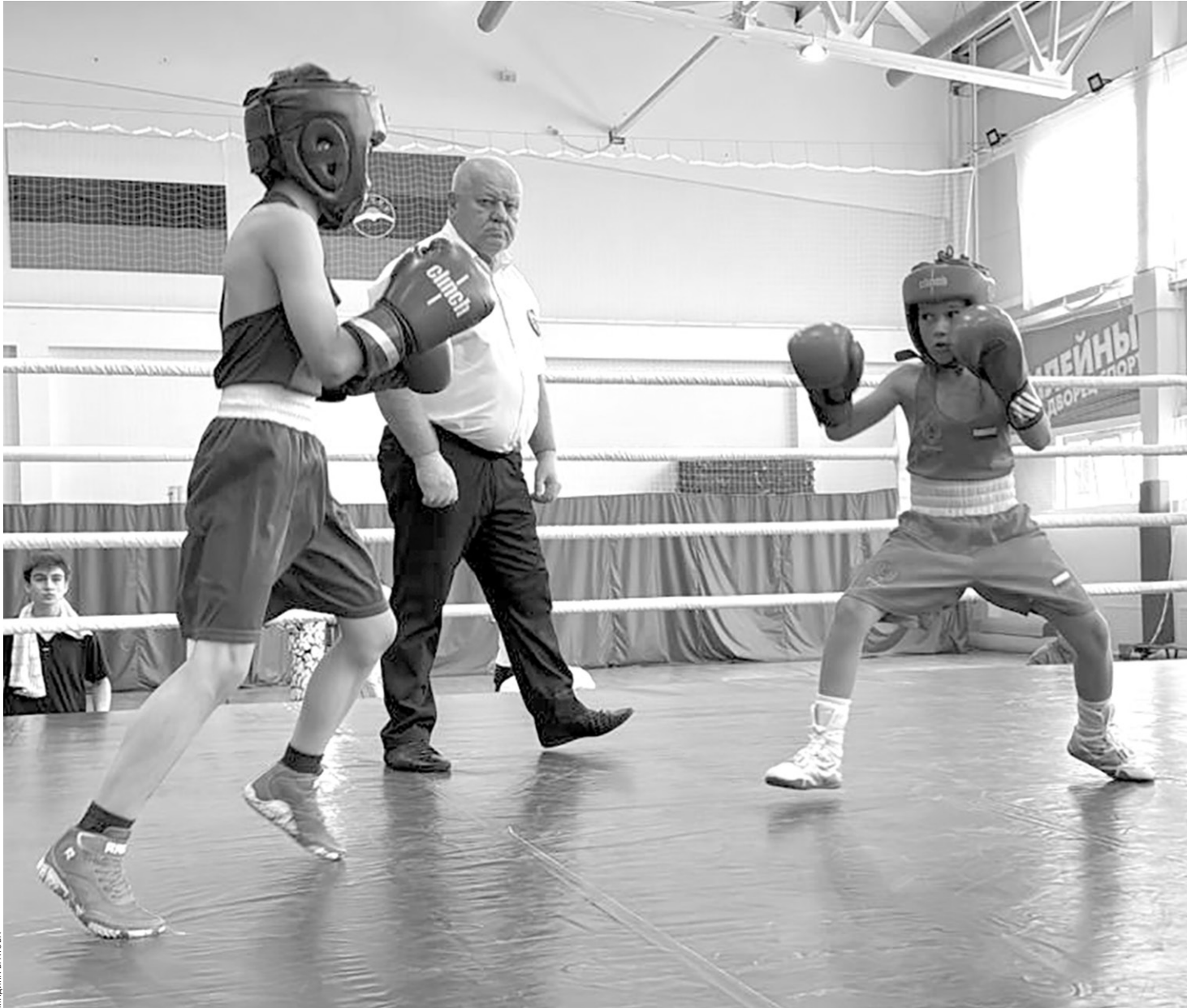
Юные участники соревнований были серьезно настроены на честную борьбу за победу

А ребята были настроены очень серьезно. Например, Ми-