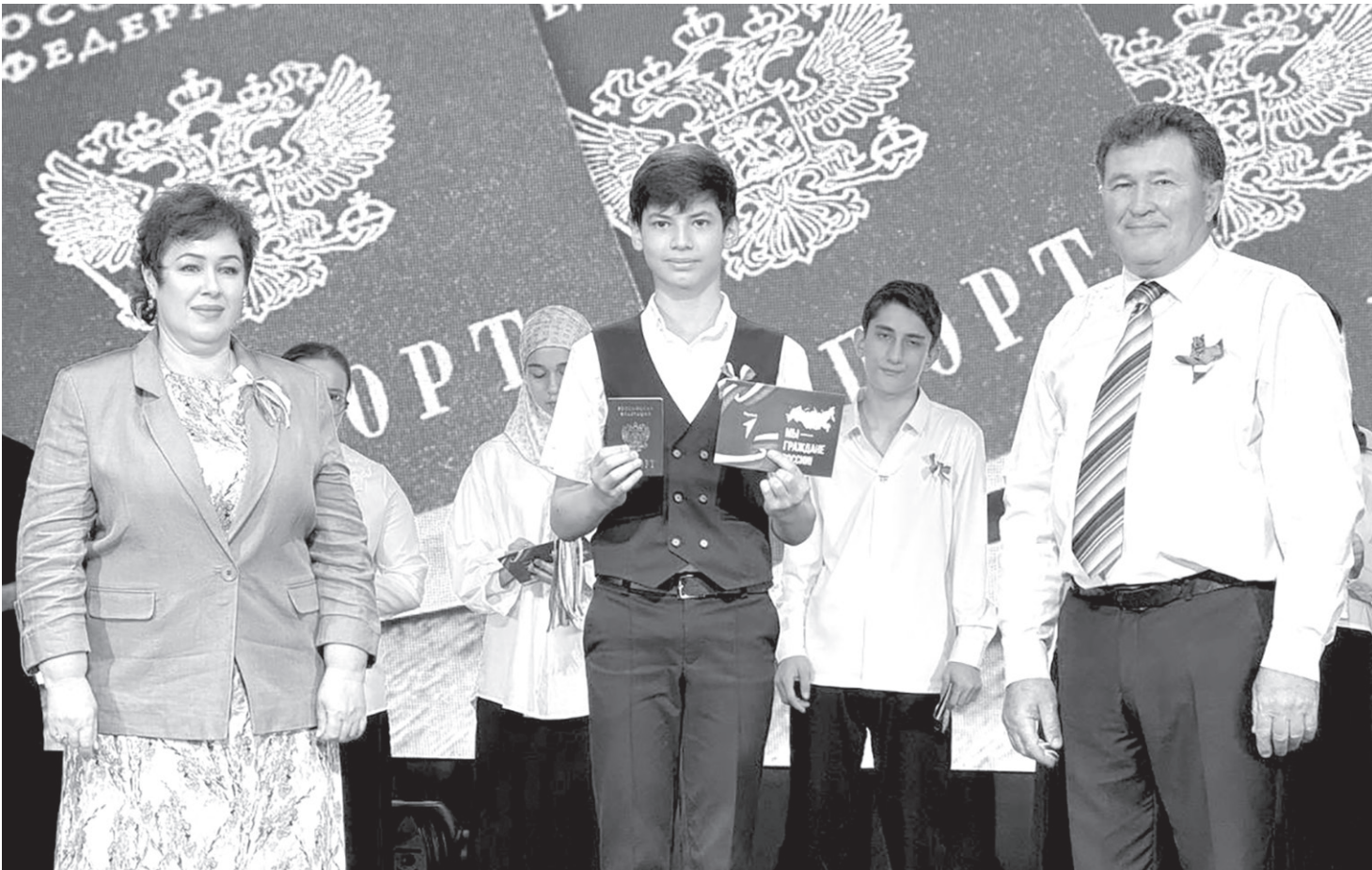
Во всех городах и районах в этот день состоялась церемония вручения паспортов гражданина РФ юным жителям республики, достигшим 14 лет

Велопробег состоялся и в Но- гайском районе. В нем приняли